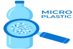
[미세플라스틱 분석 장비]