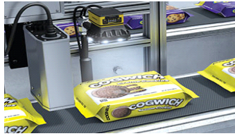
[포장재 검사 장비]